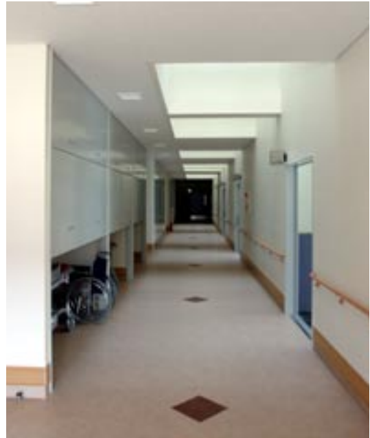
整然とした通路は学ぶ事柄の品質の高さをものごとります。