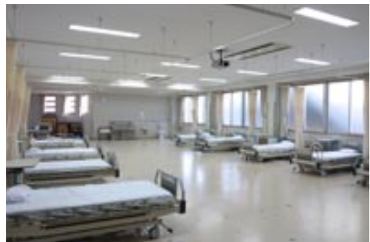
十分な広さが実習には大切なのです。