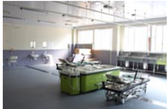
広くて明るい清潔な実習室です。