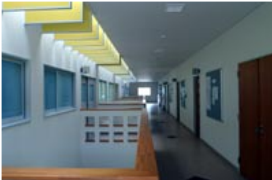
イエローとパープルの配色が心落ちつかせます。