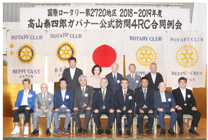
ガバナーとの記念写真撮影