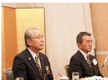
高山ガバナーと 平野ガバナー補佐