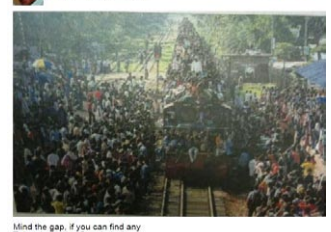
Mind the gap, if you can find any Taken in Dhaka, Bangladesh