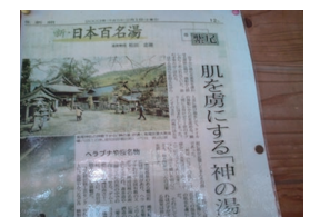
新日本百名湯にも選ばれ、美肌効果も注目されました。

山の中の田舎で何もありませんが、温泉通の別府の皆様にも、もし機会がありましたら一度入っていただきたい温泉です。