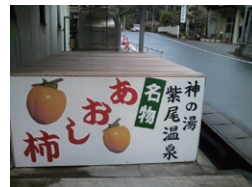
この時は時期ではなかったのでふたをしています。

また、この温泉は渋柿の渋を抜くことでも有名で、季節には渋柿専用のお風呂ができます。