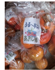
温泉の香りがほのかにして、おいしくなります。