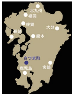
鹿児島県薩摩郡さつま町紫尾 伊佐美