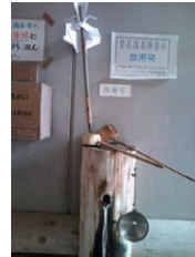
温泉を飲むための蛇口です。

別府でいくつも温泉に入って探しているのですが、まだ同じお湯にはめぐり会っておりません。