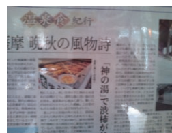
写りが悪いのですが、このように渋柿を中につけます。これは新聞記事です。