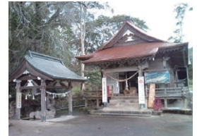
紫尾神社は小さな神社です。