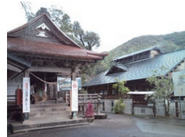
紫尾神社のすぐ横(写真右)が紫尾温泉の建物です。