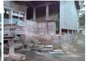
これが神社の下から湧き出ている温泉の源泉です。

また、この温泉は渋柿の渋を抜くことでも有名で、季節には渋柿専用のお風呂ができます。