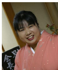
山水館の女将、お世話になりました