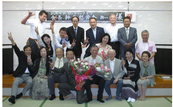
楽しい、これ以上のメンバーはない！