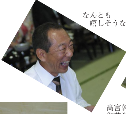
なんとも 嬉しそうな会長